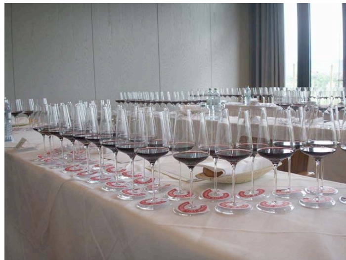
Les tables sont prêtes et attendent les dégustateurs

Les commentaires relevaient presque toujours des défauts majeurs, des boisés trop dominants, des lourdeurs de fruits trop mûrs, des déséquilibres flagrants : le merlot, comme le pinot noir, ne souffre pas la médiocrité.